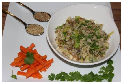
4/03 en 5/03 Rijstschotel met prei en groentjes Vegetarisch : linzen / Niet vegetarisch : casselerrib