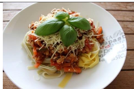
Bolognese op alle momenten beschikbaar Vegetarisch : seitan / niet-vege : Filet américain

Ik maak voor jou mooi uitgebalanceerde, verrassende en lekkere gerechten klaar die je kan komen afhalen tijdens de binnenloopmomenten.(*) om te bestellen : zie pag 2