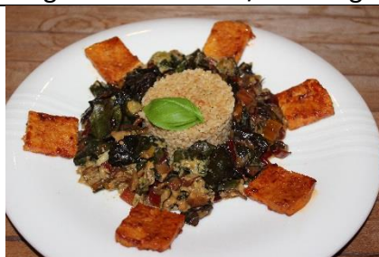
18/03 en 9/03 Oosterse groenten met couscous Vegetarisch met gemarineerde tofu Niet vegetarisch met gemarineerd varkenshaasje