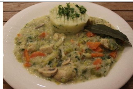
11/03 en 12/03 Gentse Waterzooi Vegetarisch met Quorn / niet Vegetarisch met kip